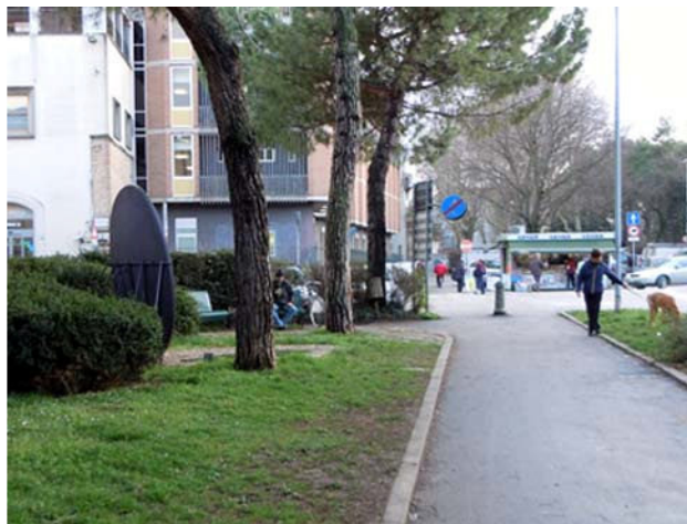
Vista del retro dell'opera da via Agostino Tolosano