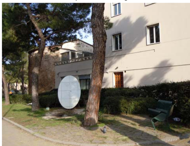
Vista da Corso Mazzini