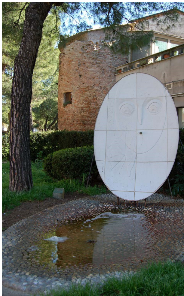
Vista da via Agostino Tolosano